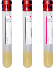
SST 튜브 3개