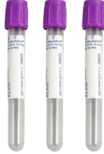
LAV 튜브 3개